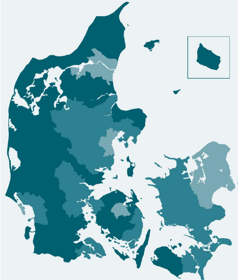
Figur 1.1 Fødevareklyngens region beskæftigelse i andel af beskæftigede.